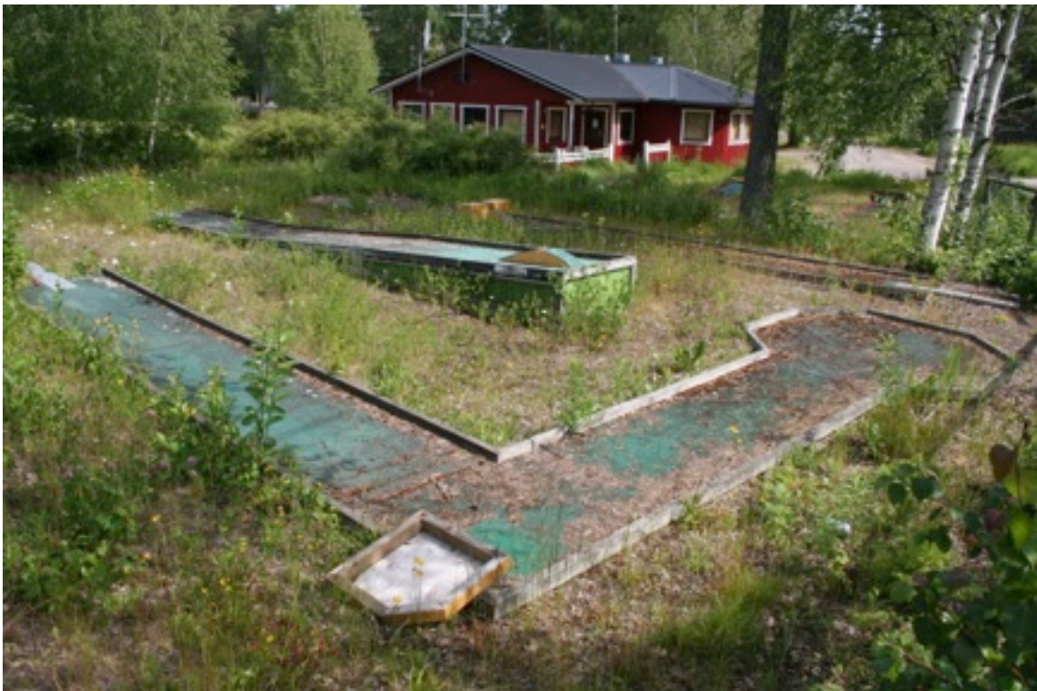
VUF Minigolf kasvaa pensaita ja kioskissa tuolit pöytien päällä. Ei näytä huippusesongilta.