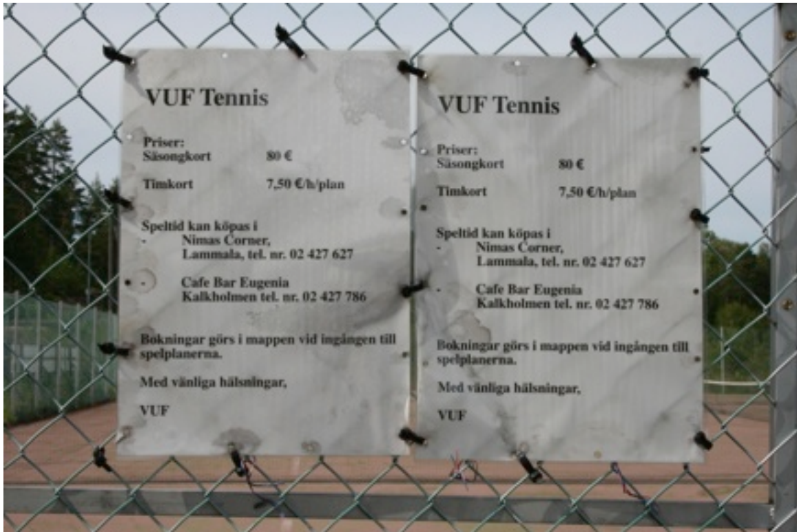
Lammalan VUF Tennis - tyhjänä ja portti avoimena.